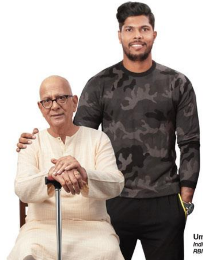
Umesh Yadav Indian Cricketer and RBI Employee

RBI has asked banks to make banking convenient for senior citizens