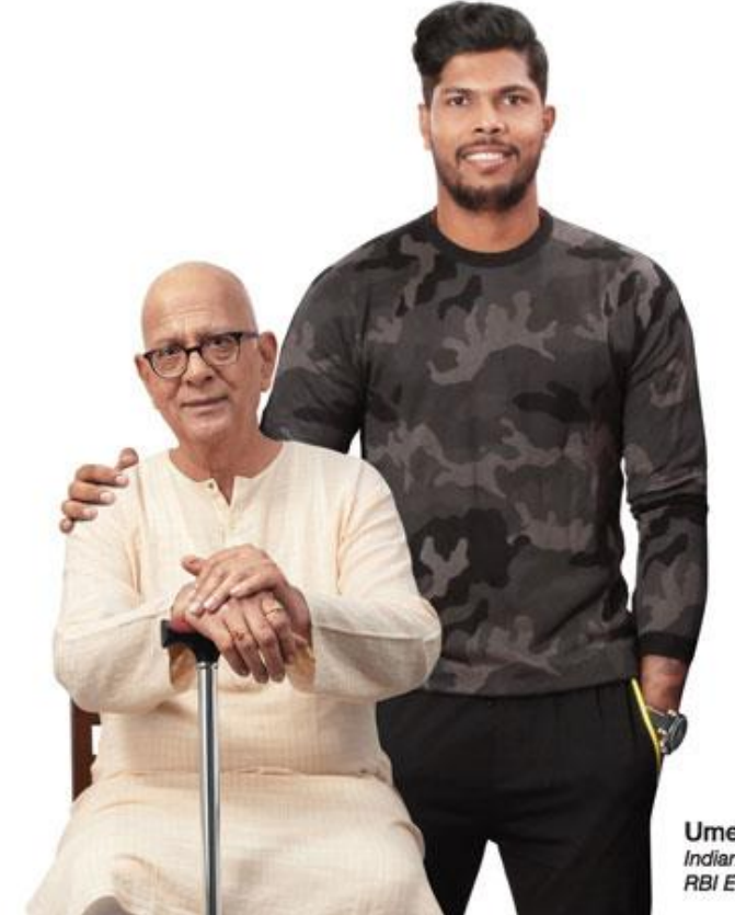
Umesh Yadav Indian Cricketer and RBI Employee

RBI has asked banks to make banking convenient for senior citizens